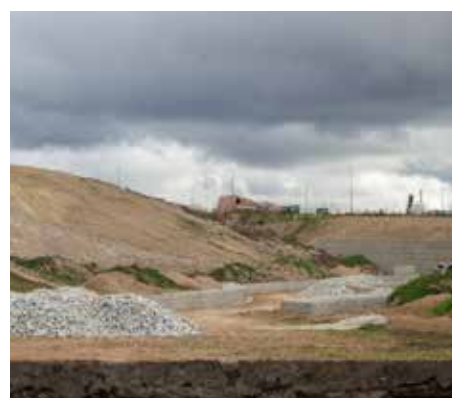
Expansão da Zona Industrial de Mirandela