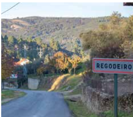
Beneficiação da estrada Múrias - Regodeiro