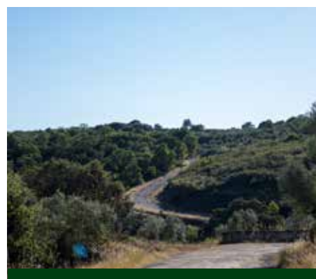
Beneficiação da estrada Alvites - Vale de Lagoa