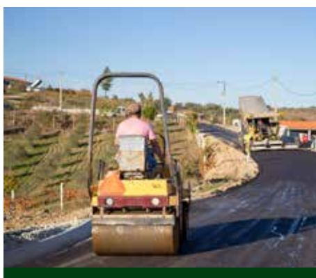
Beneficiação da estrada a Rego de Vide