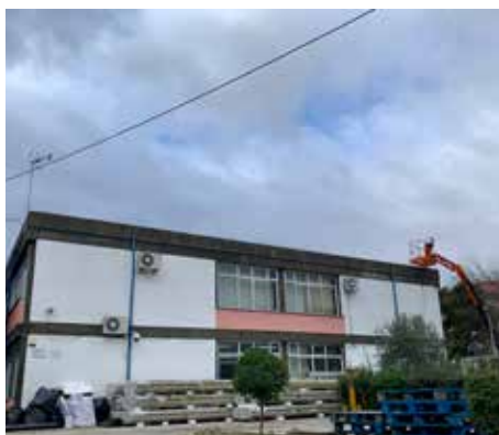
Remoção de fibrocimento na EB Luciano Cordeiro