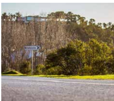
Rede de saneamento na aldeia de Bronceda