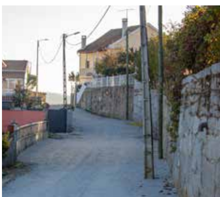
Rede de saneamento na aldeia de Vale de Maior