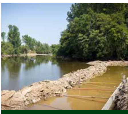
Beneficiação do açude de Abambres