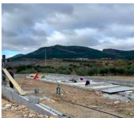
Construção de estação elevatória e ETAR em Passos