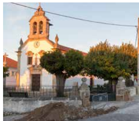
Melhoramentos na Rede de Abastecimento de Água e Arruamentos em Mascarenhas