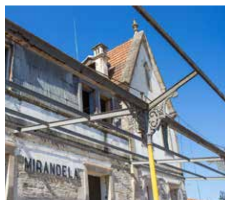
Requalificação da Estação de Caminhos de Ferro