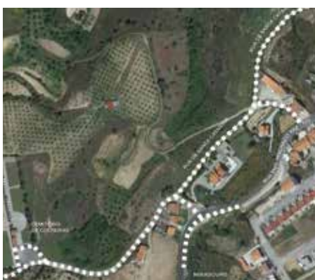
Vias pedonais e pavimentação da rua Sta. Catarina