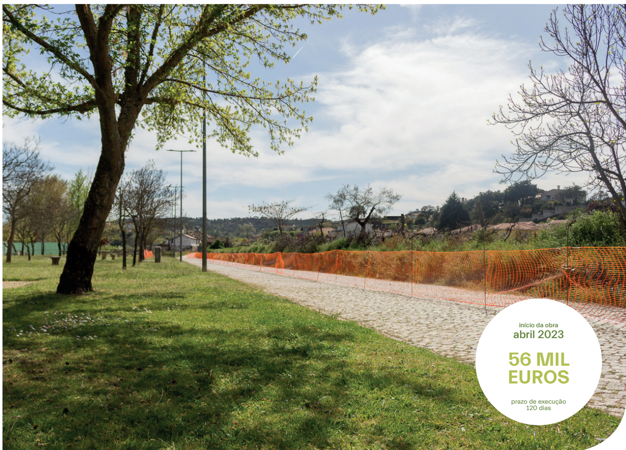
Criação de um Parque de Autocaravanas

início da obra abril 2023 56 MIL EUROS prazo de execução 120 dias