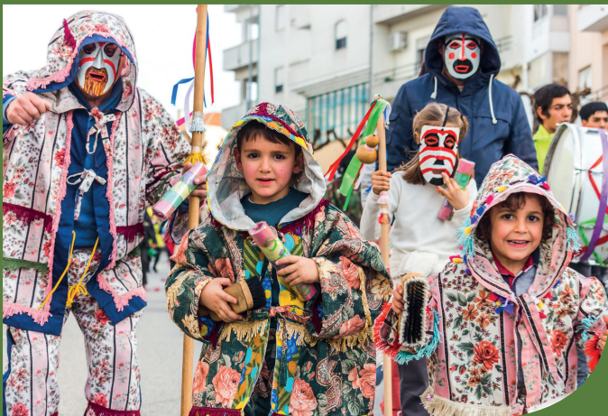
Entrudo Trapalhão 2023

Estas iniciativas têm vindo a afirmar-se como parte integrante da estratégia económica e cultural do território, fazendo destes uma aposta na diferenciação e no desenvolvimento do concelho.