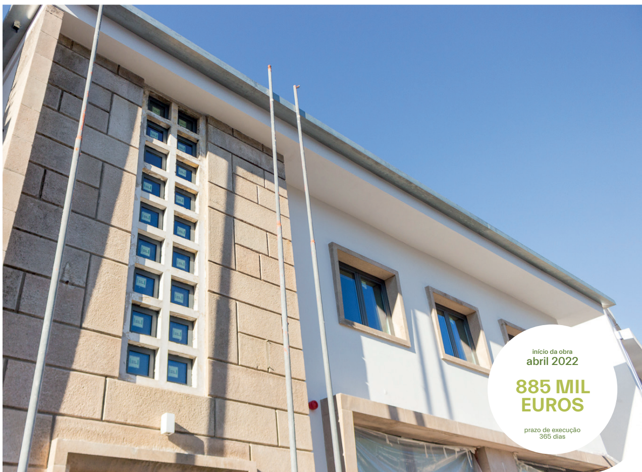
Reabilitação do antigo edifício do quartel dos Bombeiros

início da obra abril 2022 885 MIL EUROS prazo de execução 365 dias