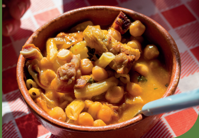
Festival Gastronómico do Rancho de Mirandela