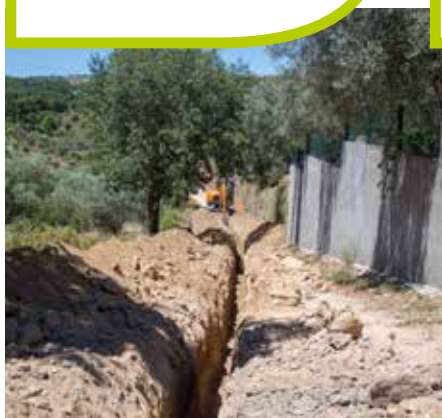
Melhoramento do sistema de abastecimento de água em Ribeirinha - Fradizela.