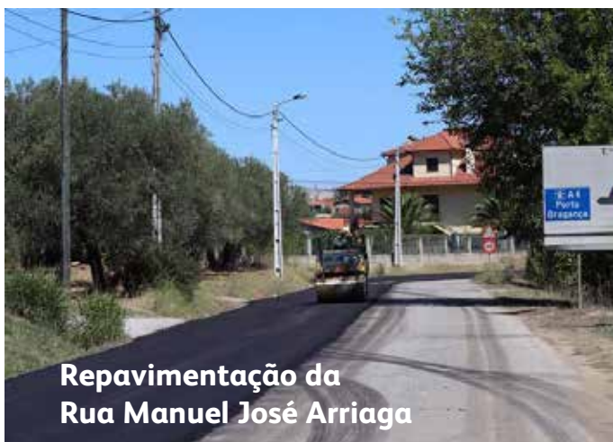
Repavimentação da Rua Manuel José Arriaga

A central de camionagem foi construída na década de 90 sendo inaugurada em março de 1997, mas necessitava com urgência de obras de remodelação.