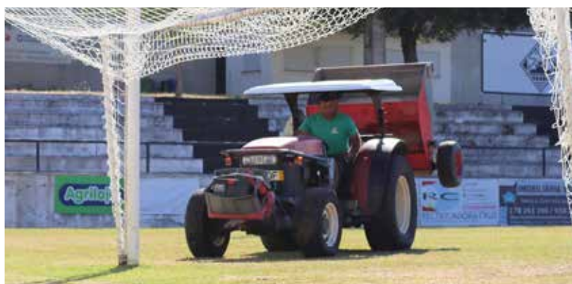
Autarquia melhora condições do relvado do Estádio S. Sebastião

A Câmara Municipal de Mirandela, em articulação com o Sport Clube de Mirandela (SCM), procedeu à reabilitação do relvado deste equipamento desportivo, utilizado para a prática de futebol profissional.