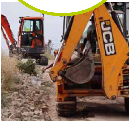
Melhoramento do sistema de abastecimento de água em Vale de Madeiro.