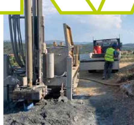
Melhoramento do sistema de abastecimento de água em Caravelas, Couços e Vila Boa.