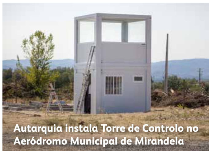
Autarquia instala Torre de Controlo no Aeródromo Municipal de Mirandela

Repavimentação da Rua Manuel José Arriaga (Quinta Branca), entre a rotunda de acesso ao Parque de Campismo da Maravilha e rotunda Portas da Cidade.