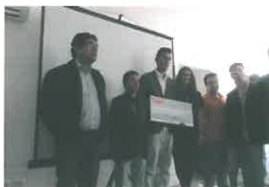
Imagem 10 a 13 – Imagens e logótipos do Seminário e Concurso de Ideias “Escola Empreendedora”

Será promovido o 2º Seminário Escola Empreendedora. Esta iniciativa do GAEE, iniciada em 2014, é executada em parceria com o Instituto Politécnico de Bragança, parceiro do GAEE.