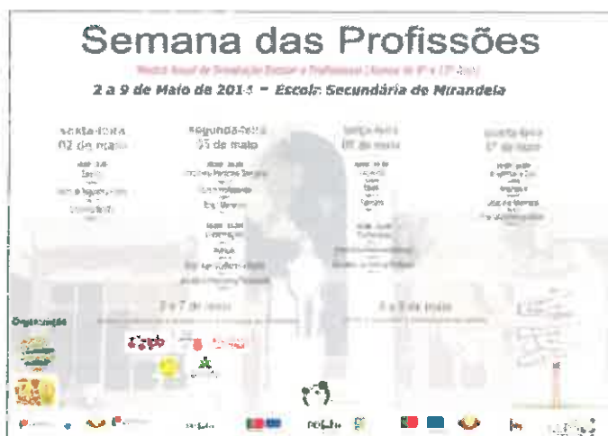
Imagem 7 - Cartaz da Semana das Profissões no Agrupamento de Escolas de Mirandela