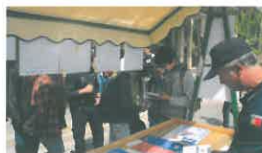
Imagem 8 e 9 – Imagens da Semana das Profissões no Agrupamento de Escolas de Mirandela

Prevê-se a realização, em parceria com o Projeto Escolhas, da 2ª edição da Semana das Profissões. Esta iniciativa, realizada também em 2014, tem como primeiro objetivo promover a definição de percursos de inserção e formação para os alunos que se encontrem em situação de conclusão ou abandono do sistema de ensino.