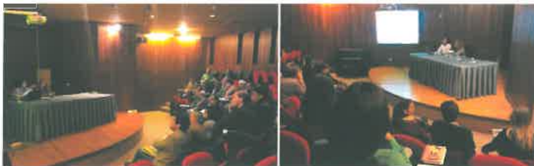
Imagens 4 e 5 - Imagem das sessões de esclarecimento sobre Medidas de Trabalho Socialmente Necessário e Atividade Socialmente Útil