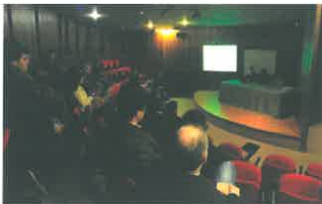
Imagem 6 – Imagem da sessão de sensibilização a empresas e entidades

Aguardando-se para o início de 2015 a divulgação das novas medidas de apoio a empresas no âmbito do novo quadro comunitário de apoio 2014-2020, serão realizadas sessões temáticas para empresários, dando a conhecer as medidas, disponibilizando simultaneamente o apoio do GAEE para as candidaturas.