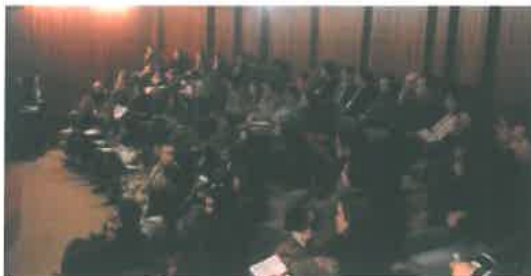
Imagem 3 - Imagem da sessão de sensibilização a desempregados

Em articulação com os parceiros do GAEE, continuará em 2015 a divulgação das medidas ativas de emprego e oportunidades de inserção. Em parceria com IEFP serão também divulgadas as medidas ativas de emprego e oportunidades de emprego e inserção tanto nos atendimentos presenciais como em sessões de formação para “Técnicas de Procura Ativa de Emprego”. Todas estas medidas e oportunidades são condensadas no site www.clds-mirandela.pt .