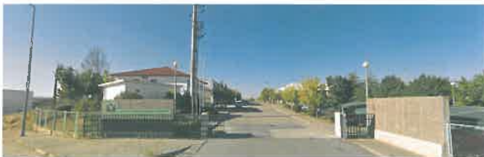
Imagem 1 – Ninho de Empresas de Mirandela – Incubadora Tua Start

Fruto do Contrato de Comodato celebrado entre o Município de Mirandela e o IEPF em 30 de maio de 2013, a gestão do Ninho de Empresas de Mirandela passou para a esfera do Município. O protocolo de criação do GAEE e o Contrato de Comodato previam, entre outras situações, que fosse esta estrutura a desenvolver a coordenação do espaço, incluindo instrução, receção e emissão de pareceres a novas candidaturas.