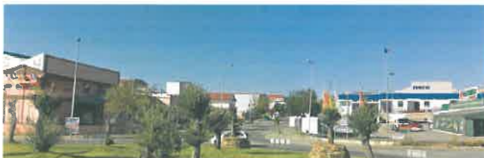
Imagem 2 – Imagem da Zona Industrial de Mirandela

No âmbito do Regulamento da Zona Industrial de Mirandela, tem sido função do GAEE a instrução de novas candidaturas à aquisição de terrenos, bem como a emissão de pareceres sobre a atribuição definitiva de propriedade plena às empresas já instaladas e que tenham cumprido com os requisitos constantes das candidaturas que estiveram na origem da entrega de lotes.